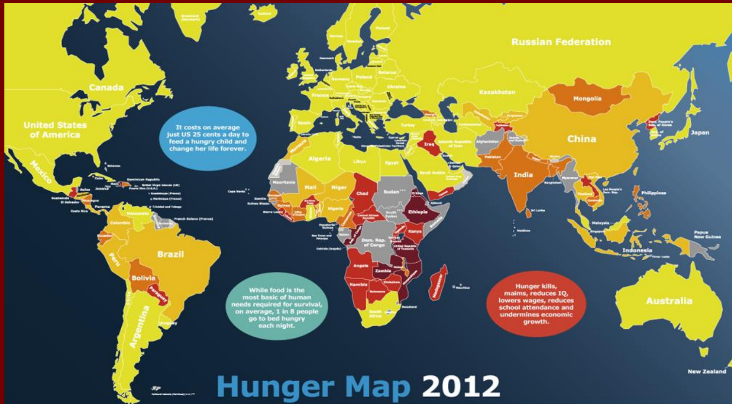
Hunger Map 2012